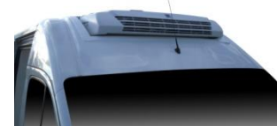
Intégration de groupe THERMOKING