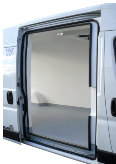
Porte latérale coulissante isolée