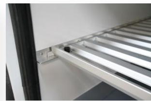
Etage avec clayettes alu amovibles

LES ÉQUIPEMENTS SPÉCIAUX - LA GARANTIE : Par équipements spéciaux, on entend un véhicule carrossé ou élaboré par les soins de carrossiers/préparateurs spécialisés avec l'accord préalable du constructeur. La garantie fournie par le réseau FIAT ne couvre pas les parties modifiées directement ou indirectement et elle est remplacée par la garantie du carrossier/préparateur