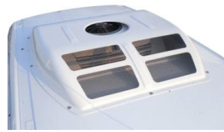
Encastrement CARRIER – THERMOKING - EDT