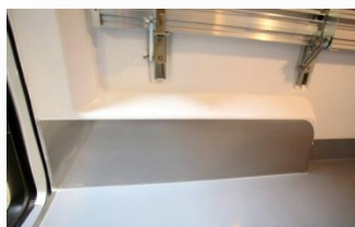
Protection inox caisson de roue