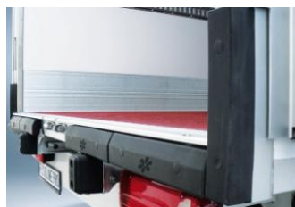
Pack pro avec option OT: butoirs renforcés.