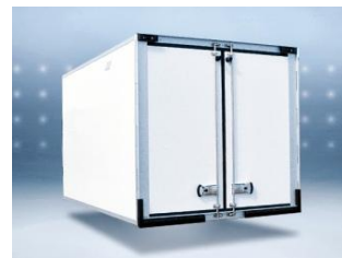
Option OT2 & Pack Pro, cadre AR boulonné renforcé