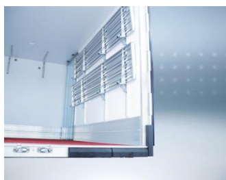
Sur OT Pack Pro: montants verticaux de cache triplés INOX.

Porte lat. battante (900 x hi, position comprise entre à partir de 100 mm de l’AV). Cloison pour véhicule multi-température, étagères réglables & relevables, rails, lisses, Interinox, penderies viande (sur BEEF et PRO BEEF) équipements poissonniers.