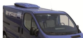
Groupe KERSTNER sous cache aérodynamique