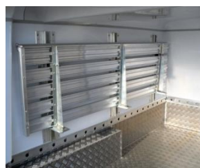
Options: étagères réglables et relevables & Rails d'arrimage « aéro » horizontal