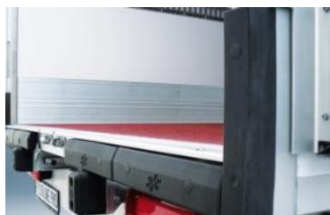
Pack Pro OT: butoirs renforcés

Porte lat. battante (900 x hi, position comprise entre à partir de 100 mm de l'AV). Cloison pour véhicule multi-température, étagères réglables & relevables, rails, lisses, Interinox, penderies viande (sur BEEF et PRO BEEF) équipements poissonniers.