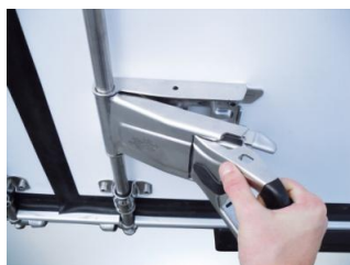
Poignée « easy handle » 1 mouvement