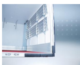
Pack Pro: OT2 montants verticaux de cadre triplé inox.