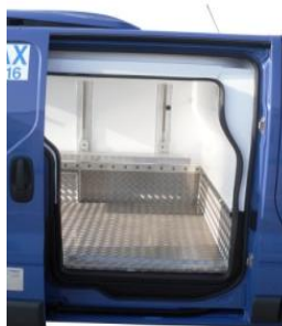
Accès par porte latérale isolée