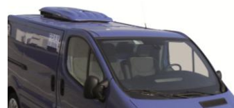
Groupe KERSTNER sous cache aérodynamique