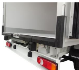
Protection arrière renforcé « pack Pro »