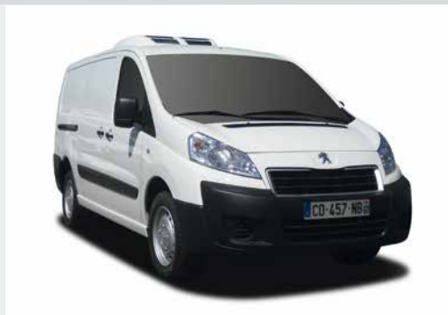
Groupe froid négatif semi-encasté compatible porte latérale