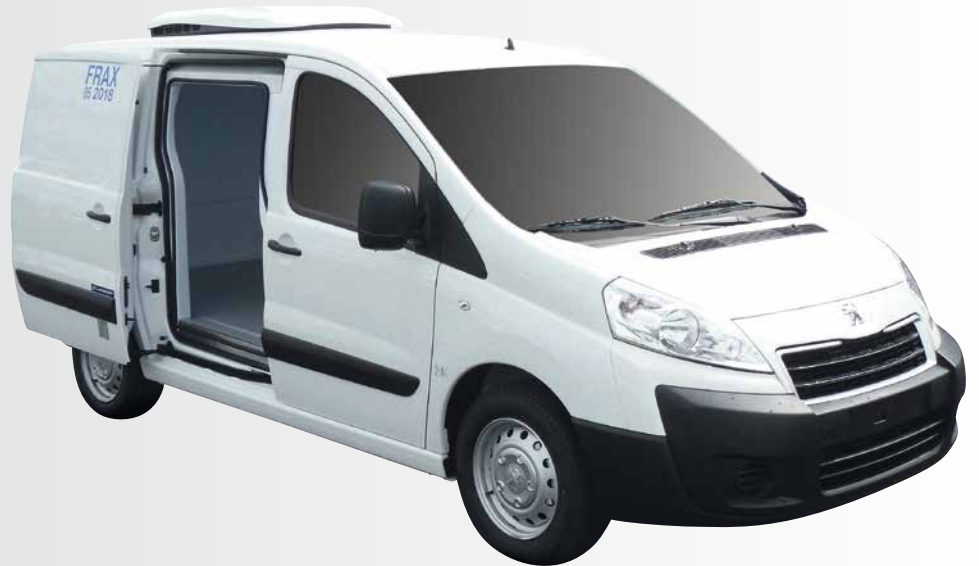
Porte latérale isolée de série, avec agrément "isotherme renforcé"