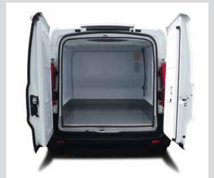
Capacité de chargement optimisée, adaptée palettes / Eurobox

Volume optimal : 3.4 M 3 - 30 EUROBOX (0.6x0.4x0.32 m) PALETTISABLE entre passage de roue