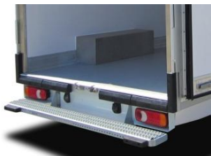
Pack Pro OT: butoirs renforcés et cadre triplié inox