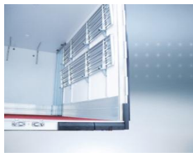
Pack Pro OT2: montants verticaux de cadre triple inox.