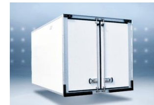
Option OT2, cadre AR boulonné (représentée: version PRO)