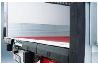
Options pack PRO et OT: Protection arrière renforcée