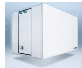
Ouverture arrière OB1 (de série)

Document non contractuel. Toutes les données sont nominales (i.e. hors tolérances) et sont susceptibles d'être modifiées sans préavis en cas d'évolution technique. Photographies issues de prototypes ou de préséries, pouvant présenter des équipements en option ou accessoires. 072013