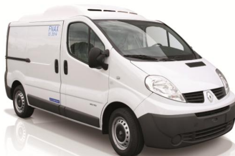
Groupe en applique sous carénage de pavillon