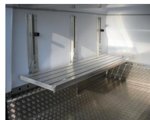
Etagères réglables et relevables – Rails d'arrimage

Document non contractuel. Visuels pouvant présenter des équipements optionnels. Dans le cadre de sa politique d'améliorations continues, LAMBERET se réserve le droit de modifier les caractéristiques des transformations sans préavis. Crédit photos LAMBERET SAS – 072013