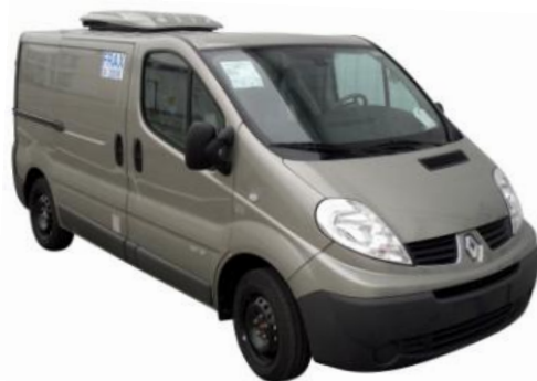
Groupe KERSTNER semi-encasté sous cache aérodynamique peint.