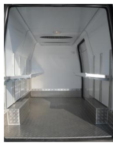
Etagères réglables et relevables