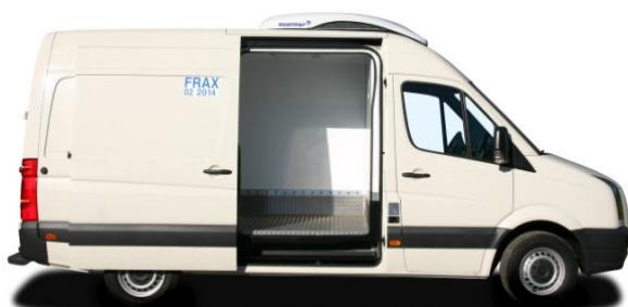
Porte latérale coulissante

Etagères réglables et relevables sur support renforcé ; Elément d'étage formant bac (zone arrière seule ou arrière + avant) ; Seuil marée ; Lisses de protection aluminium ; Rails d'arrimage ; Sangles d'arrimage ; Barre ronde d'arrêt de charge ; Rideaux anti-dépersion ; Cloison pour bi-compartment.