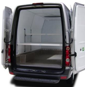
Eléments d'étage formant bac